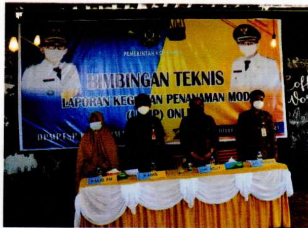
Menyanyikan Lagu Indonesia Raya