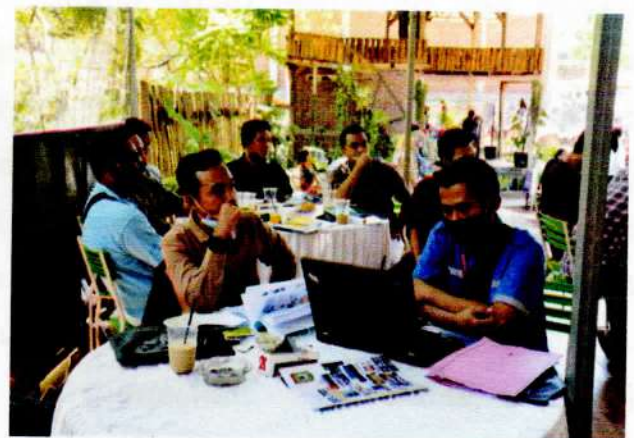
Peserta Bimbingan Teknis