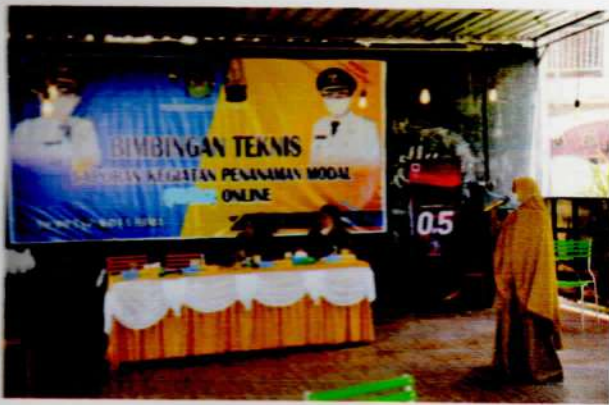
Narasumber Kepala Bidang Penanaman Modal