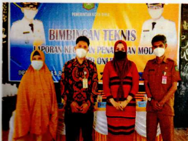
Foto Bersama Narasumber

Kegiatan dilaksanakan di Soehendar Coffe dengan dokumentasi adalah sebagai berikut: