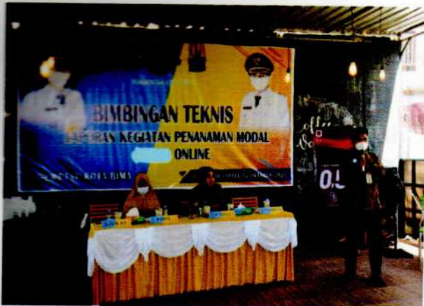
Narasumber KPP Pajak Pratama