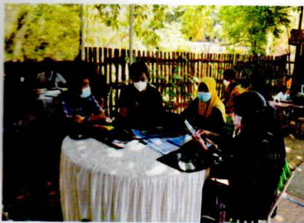
Peserta Bimbingan Teknis