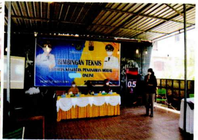
Narasumber KPP Pajak Pratama