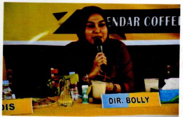
Narasumber dari Bolly Departement Store