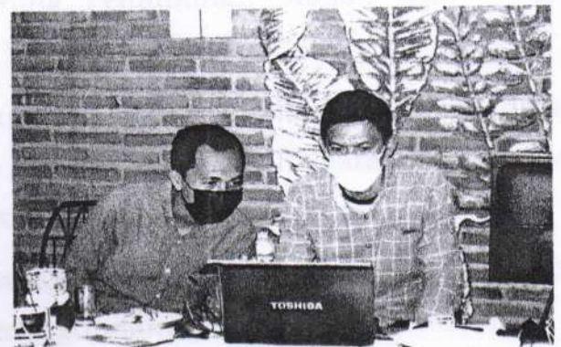
Uji Coba LKPM oleh peserta