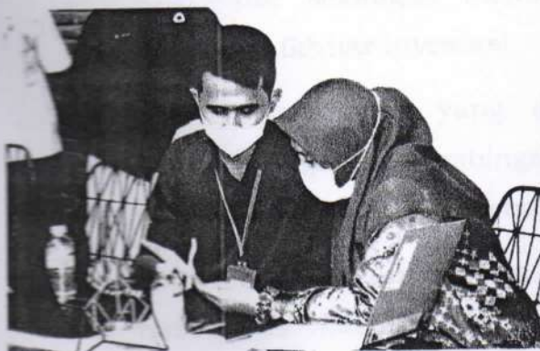
Uji Coba LKPM oleh peserta