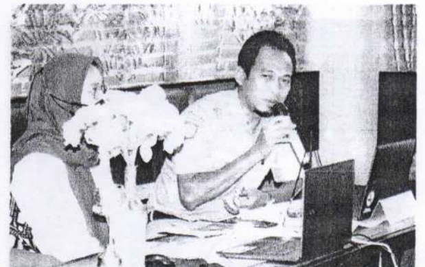
Narasumber dari Dinas Lingkungan Hidup