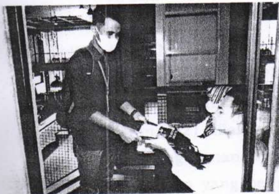
Registrasi Ulang Peserta