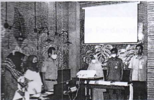
Menyanyikan Lagu Indonesia Raya