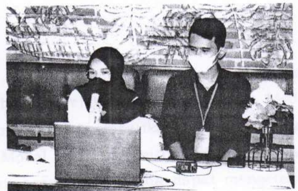
Bimbingan Teknis LKPM