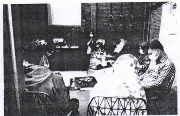
Diskusi dan Tanya Jawab