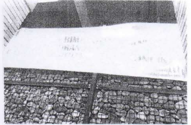
Spanduk Selamat Datang