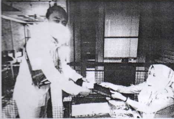
Registrasi Ulang Peserta