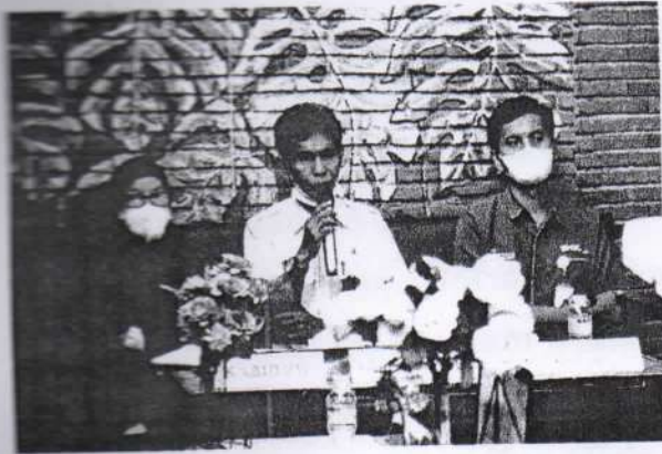
Moderator dan Narasumber