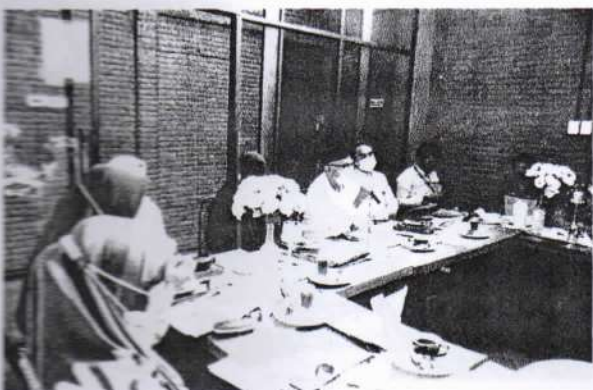
Diskusi dan Tanya Jawab