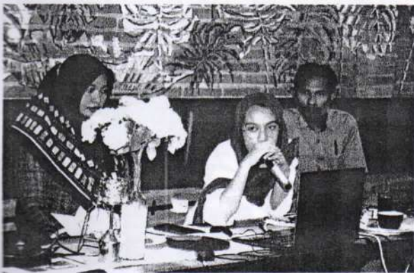
Narasumber Tenaga Pendamping