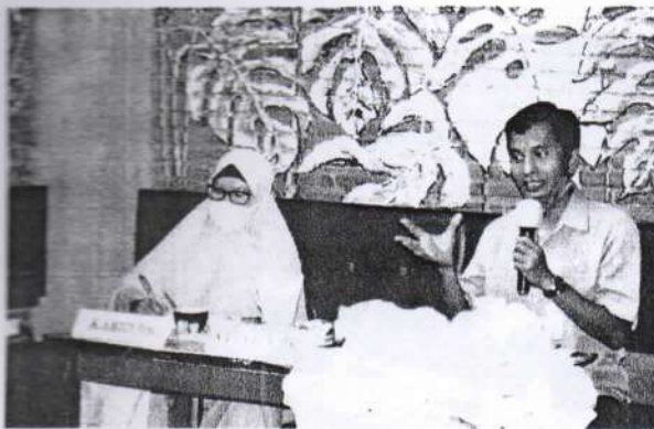
Narasumber dari BPJS Ketenagakerjaan