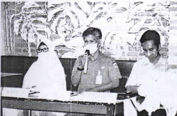
Sambutan Kepala Dinas