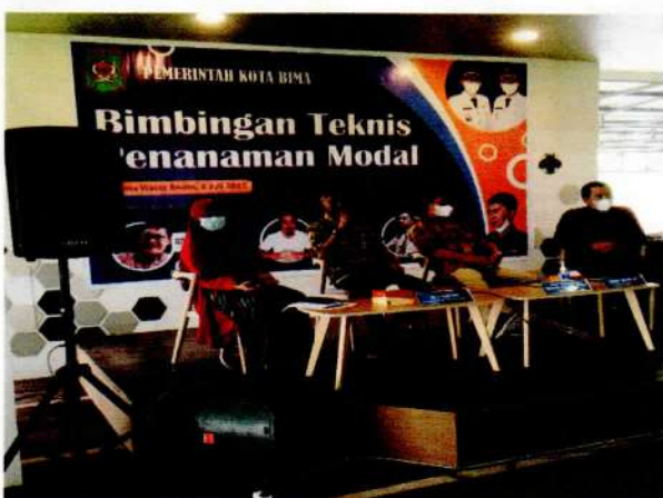
Sambutan Kepala Dinas