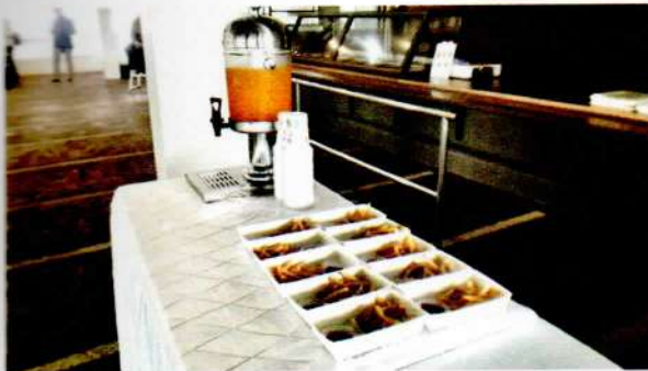
Snack dan Juice