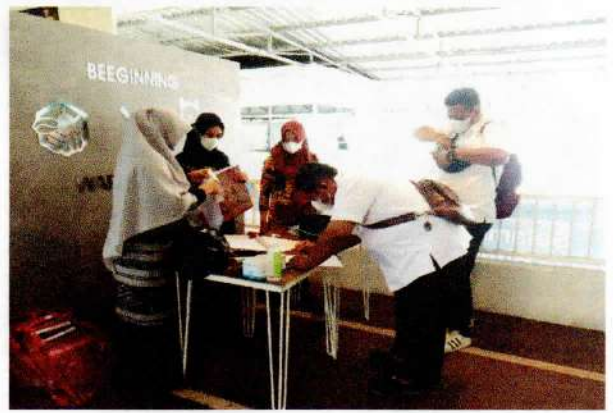
Registrasi Ulang Peserta