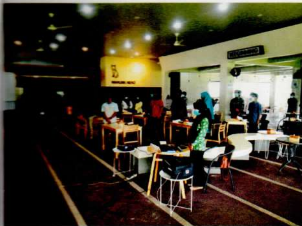
Menyanyikan Lagu Indonesia Raya