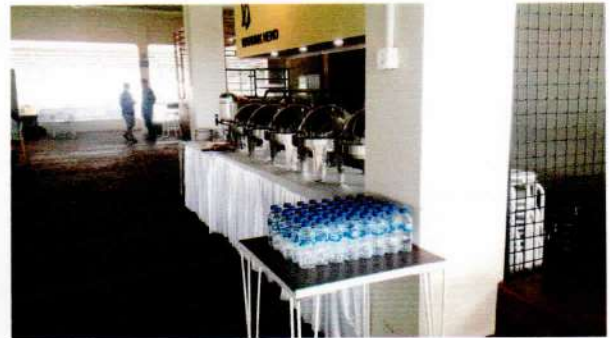
Makan Siang Prasmanan