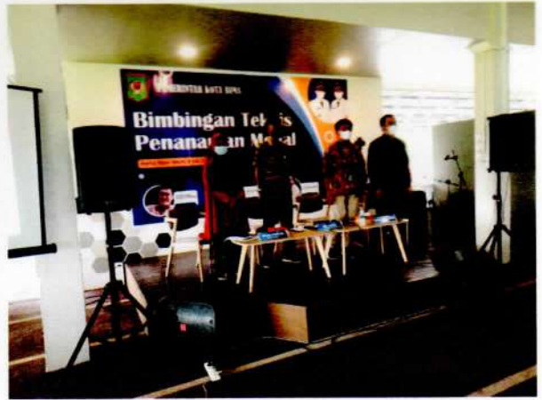
Menyanyikan Lagu Indonesia Raya