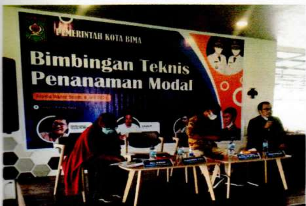
Narasumber I : dari BAPPEDA