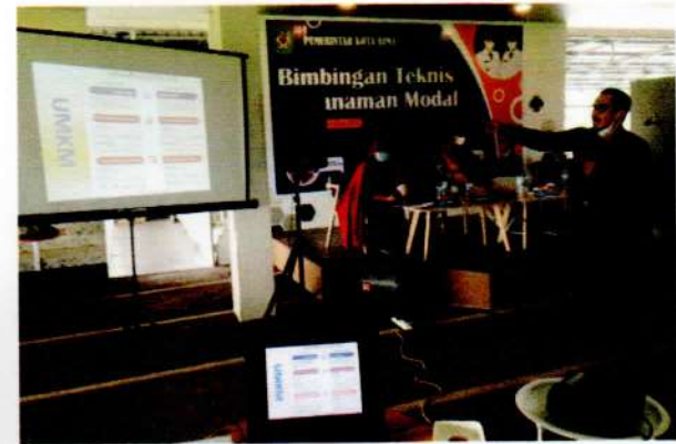
Narasumber II : dari Dinas Koperindag