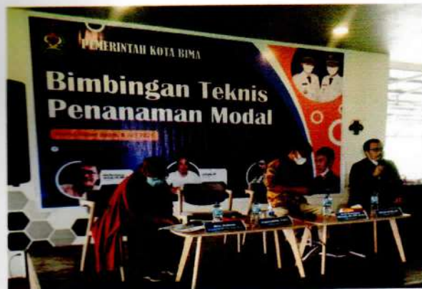
Narasumber I : dari BAPPEDA