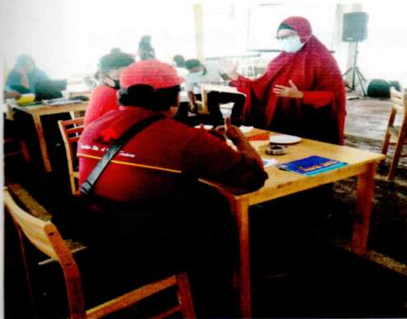
Pengarahan Bimbingan Teknis