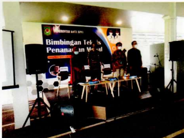
Menyanyikan Lagu Indonesia Raya