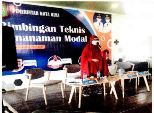
Kabid. Penanaman Modal

Materi Sosialisasi terdiri dari 3 (tiga) yaitu :