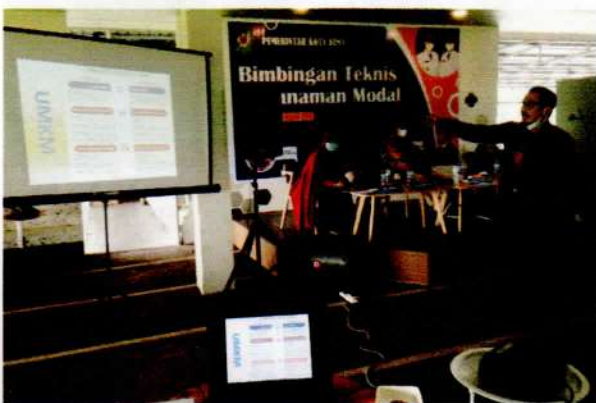
Narasumber II : dari Dinas Koperindag