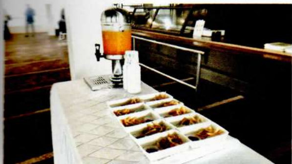
Snack dan Juice