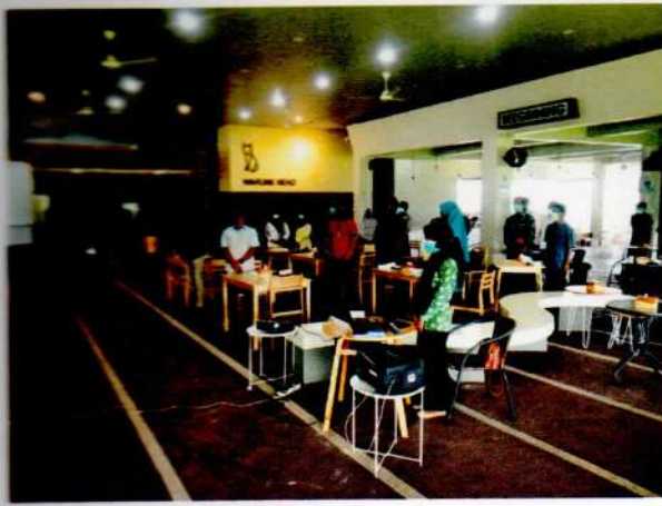
Menyanyikan Lagu Indonesia Raya