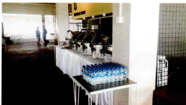
Makan Siang Prasmanan