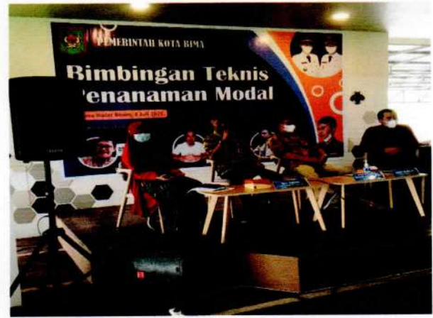
Sambutan Kepala Dinas