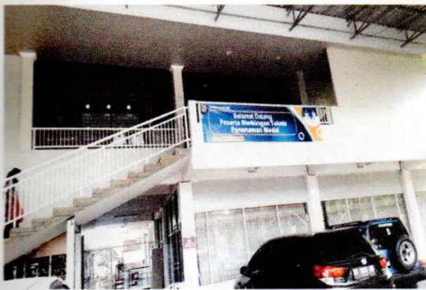
Spanduk Selamat Datang

Jumlah peserta yang mengikuti Kegiatan sebanyak 50 (Lima puluh) orang peserta yang terdiri dari para Pelaku Usaha/perwakilan Perusahaan, Narasumber, Panitia serta Dinas Penanaman Modal dan Pelayanan Terpadu Satu Pintu dengan daftar absen terlampir.