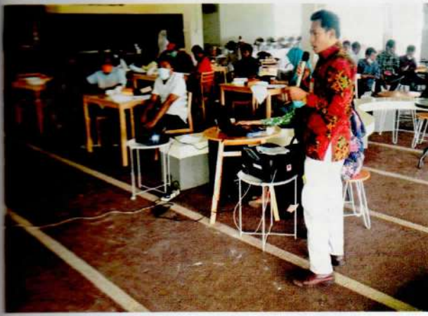
Narasumber III : dari Dispenda Prov. NTB