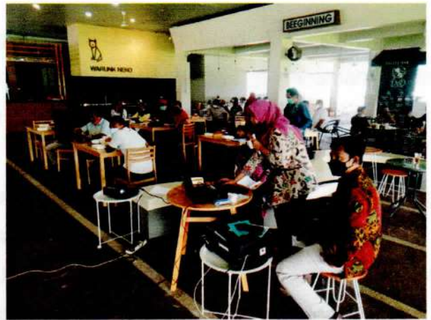
Penjelasan Tenaga Pendamping