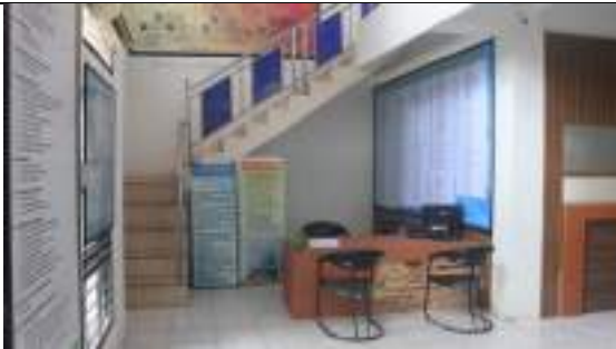
Pojok media LKPM pada tahun 2021