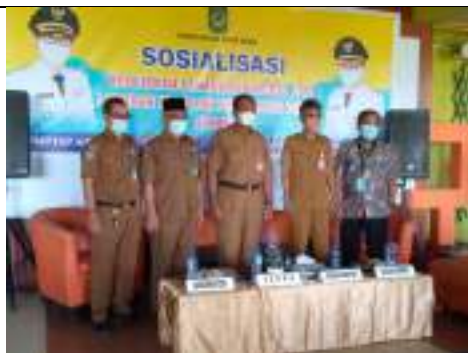
Sosialisasi sekaligus mempromosikan Pojok Media LKPM