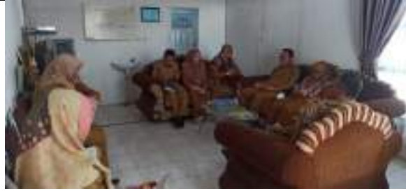
Rapat Koordinasi dengan Kepala Dinas