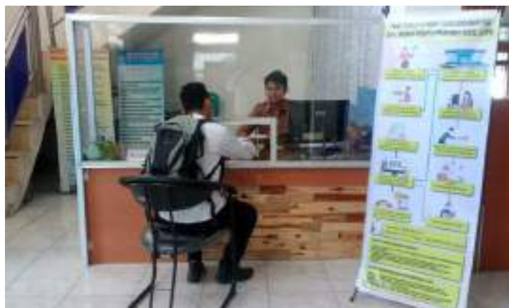
Pelayanan dan Konsultasi LKPM