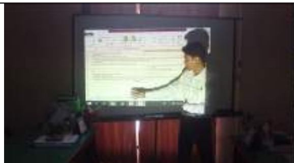
Mengelompokkan dan Menganalisa Data