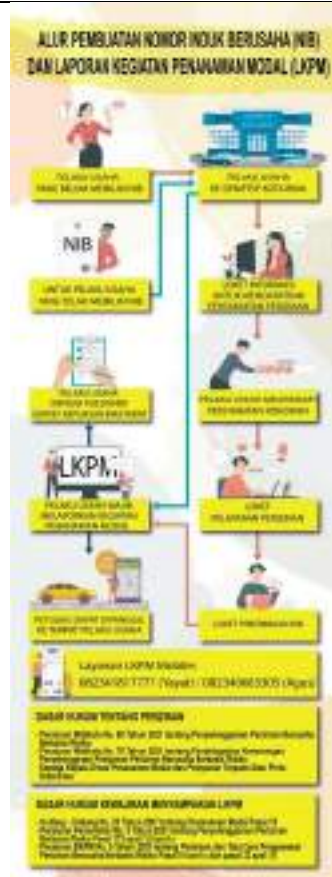
Alur Pelayanan Perizinan hingga Pelaporan LKPM