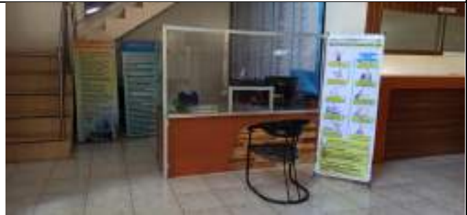
Pojok Media LKPM pada tahun 2022