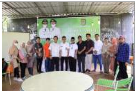
Bimtek sekaligus mempromosikan Pojok Media LKPM